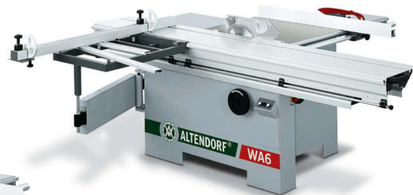
WA 6 em modelo não CE, mostrada com um carro de plataforma dupla de 2 600 mm