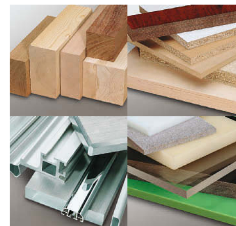
A WA 6 corta madeiras, plásticos e metais não ferrosos.

A Altendorf WA 6 é uma esquadrejadeira fabricada para atender as exigências do trabalho profissional. Desde a fundação da empresa e a invenção da serra circular esquadrejadeira por Wilhelm Altendorf em 1906, o nome Altendorf é sinônimo para este tipo de máquina no mundo inteiro. A Altendorf é, há décadas, líder do mercado mundial e já vendeu mais de 110 000 esquadrejadeiras em mais de 120 países. Em seus duas locais de produção, na Minden, Alemanha, e na Qinhuangdao, China, a Altendorf emprega a mais moderna tecnologia e o mais alto padrão de fabricação.