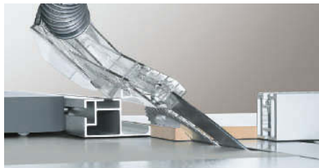
Corte angular no batente paralelo com a peça no carro de plataforma dupla.