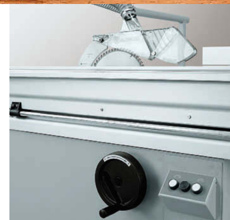
Regulagem manual da altura da serra.