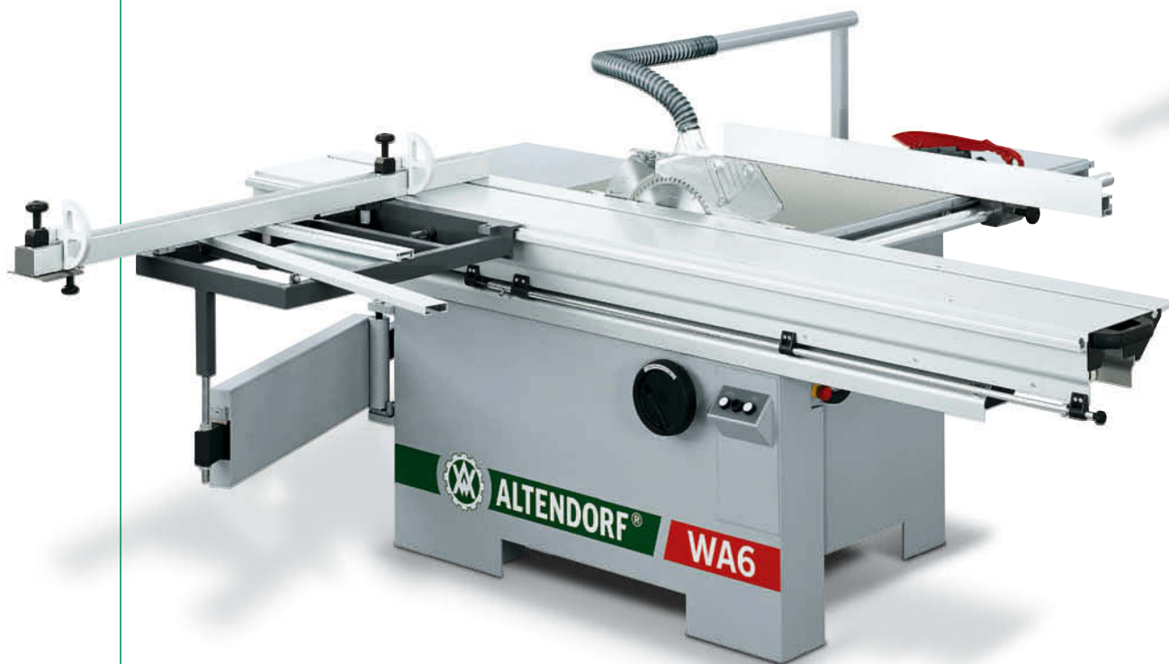
WA 6 em modelo CE, mostrada com um carro de plataforma dupla de 2 600 mm