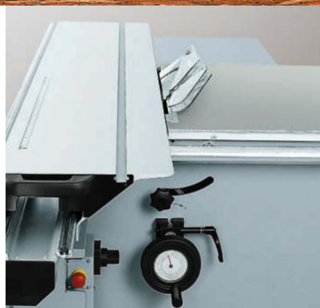
Regulagem manual da inclinação da serra.