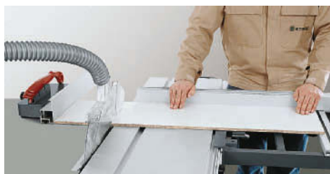
Cortar tiras no batente paralelo com medida pronta de comprimento.