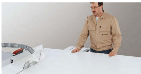
Cortar a placa em tiras no batente paralelo.