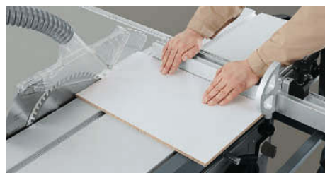
Cortar a peça restante na largura junto ao batente angular.