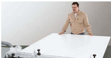
Posicionar a placa e efetuar o corte de bordas.