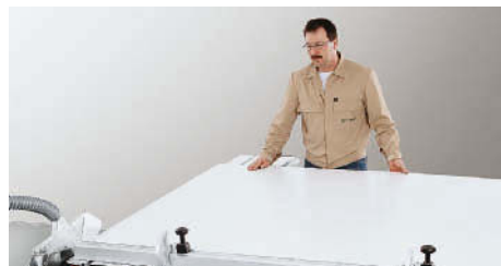
Legenda: Executar o corte angular.