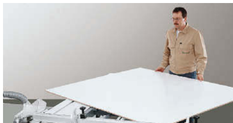
Girar a placa no sentido anti-horário e encostar a borda cortada no batente angular.