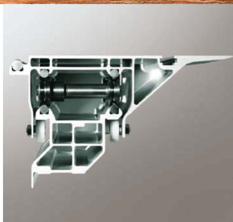
Sistema de múltiplas câmaras ocas proporcionam ao carro de plataforma dupla elevada resistência à torção.