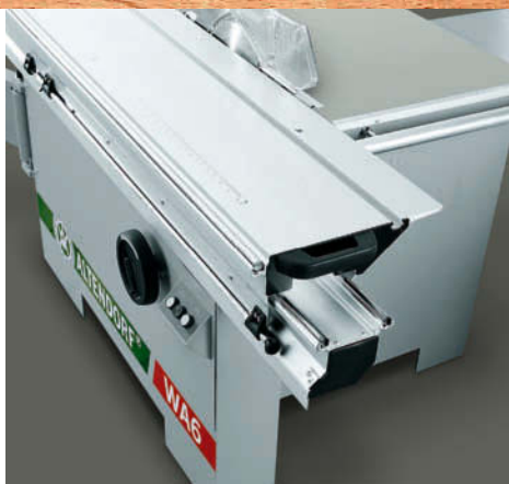
O comprovado carro de plataforma dupla Altendorf com guia em aço.