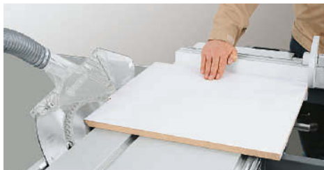
Inclinar o disco de corte à medida pretendida e encostar a peça no batente esquadrejador.