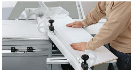
Corte em meia-esquadria com no batente esquadrejador.