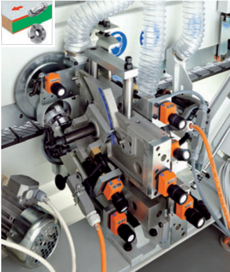
Tilting top and bottom trimming unit RI-501. Two independent high frequency motors (0.65 kW each) which can be tilted from 0 to 25 degrees.

Chanfreineuse inclinable RI-501. Deux moteurs à haute fréquence (de 0.65 kW chacun) indépendants et inclinables de 0 à 25 degrés.