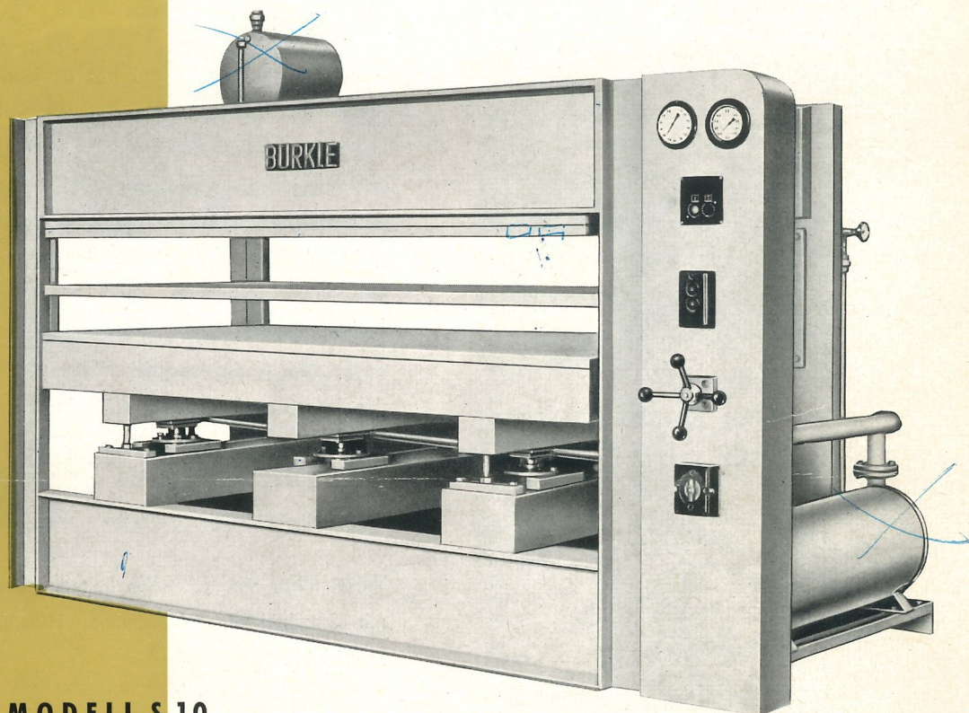
MODELL S 10