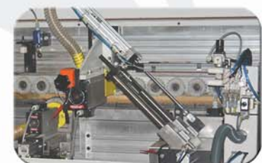
Grupo retestador para corte automático en recto o bisel.