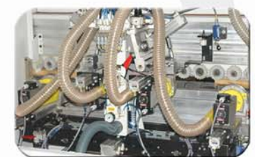
Grupo de ribeteador. de formas con 4 motores.