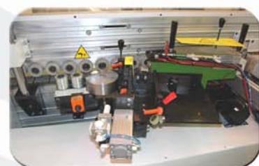
Zona de encolado y presión.