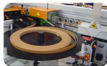
Zona de entrada con vista de grupo repasador doble neumático

Cabinas de seguridad según normativa CE.