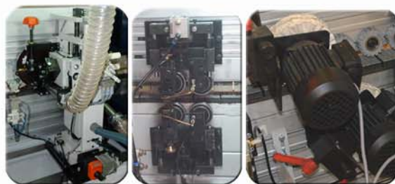
Vista de grupo rascador de radio para PVC, rascador plano de limpieza y grupo maticantos.