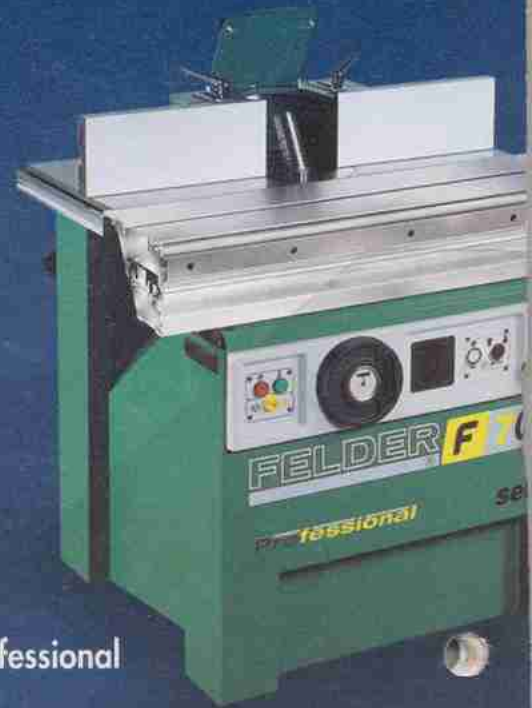
F 700 Z Professional