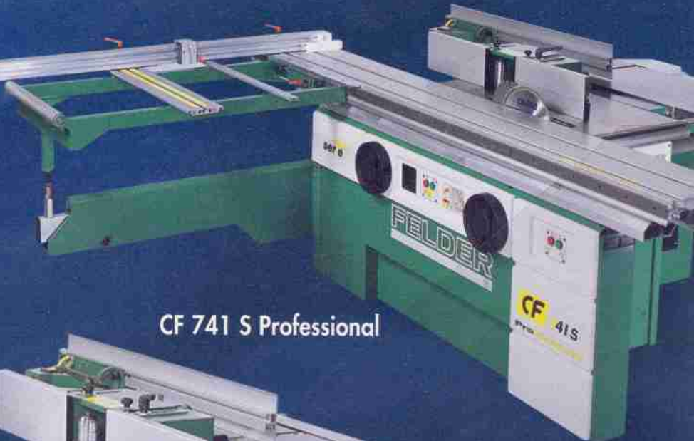
CF 741 S Professional