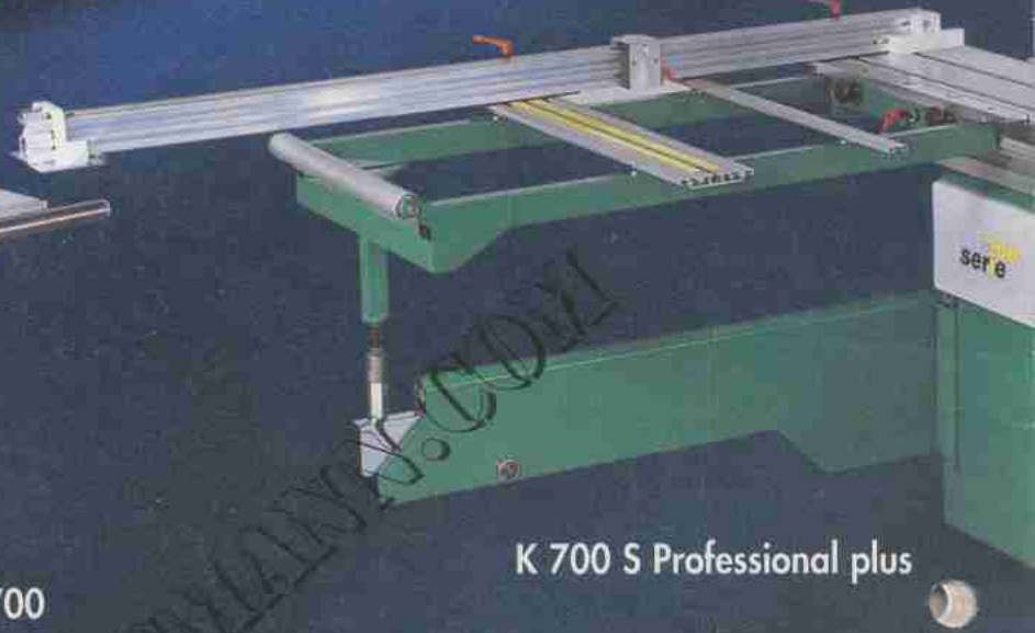
K 700 S Professional plus