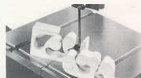
Bogenscheiden (Hier mit schräggestelltem Sägertisch)