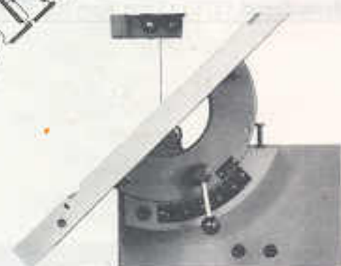
Drehsegment für Sägertisch 0°–45°