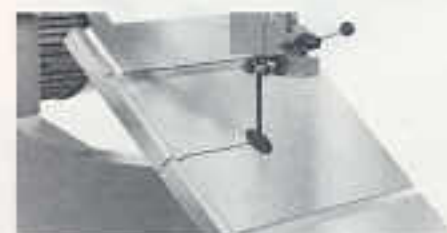
Sägertisch bis 45° neigbar