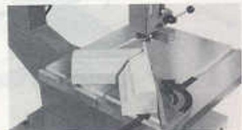
Schneiden mit einer Getrung