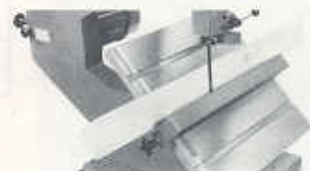
45° Längsschnitt (Auftrennen) mit Längsanschlag