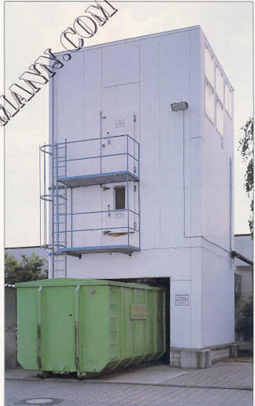
Filterhaus, Typ PFHA mit oberer und unterer Isolierverkleidung

Großfilteranlagen für umfangreiche Luft- und Späne-mengen (bis 100.000 m 3 /h), mit großem Expansions- und Zwischenlagerraum sowie Rührwerkaustragung. Stabile und kompakte Bauweise mit Stahlunterbau, Revisionsgang, Steigleiterpodest und wahlweise Aluminium- oder Isolierverkleidung. Auch als Spezialausführung für kontinuierlichen Betrieb lieferbar.