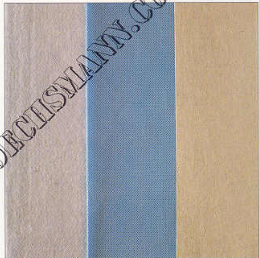
Für jeden Bedarfsfall das richtige Filtermedium: Baumwoll-Nesselstoff, Polyester Nadelfilz, PES-Seidengewebe oder andere Spezialausrüstungen