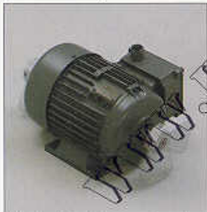
Mechanische Regeneration durch motorische Abrüttelung

Für hohe Luftdurchlässigkeit bei optimalem Abscheidegrad hat Höcker Polytechnik einen Polyester Nadelfilz mit Acryl-Membran-Beschichtung entwickelt.