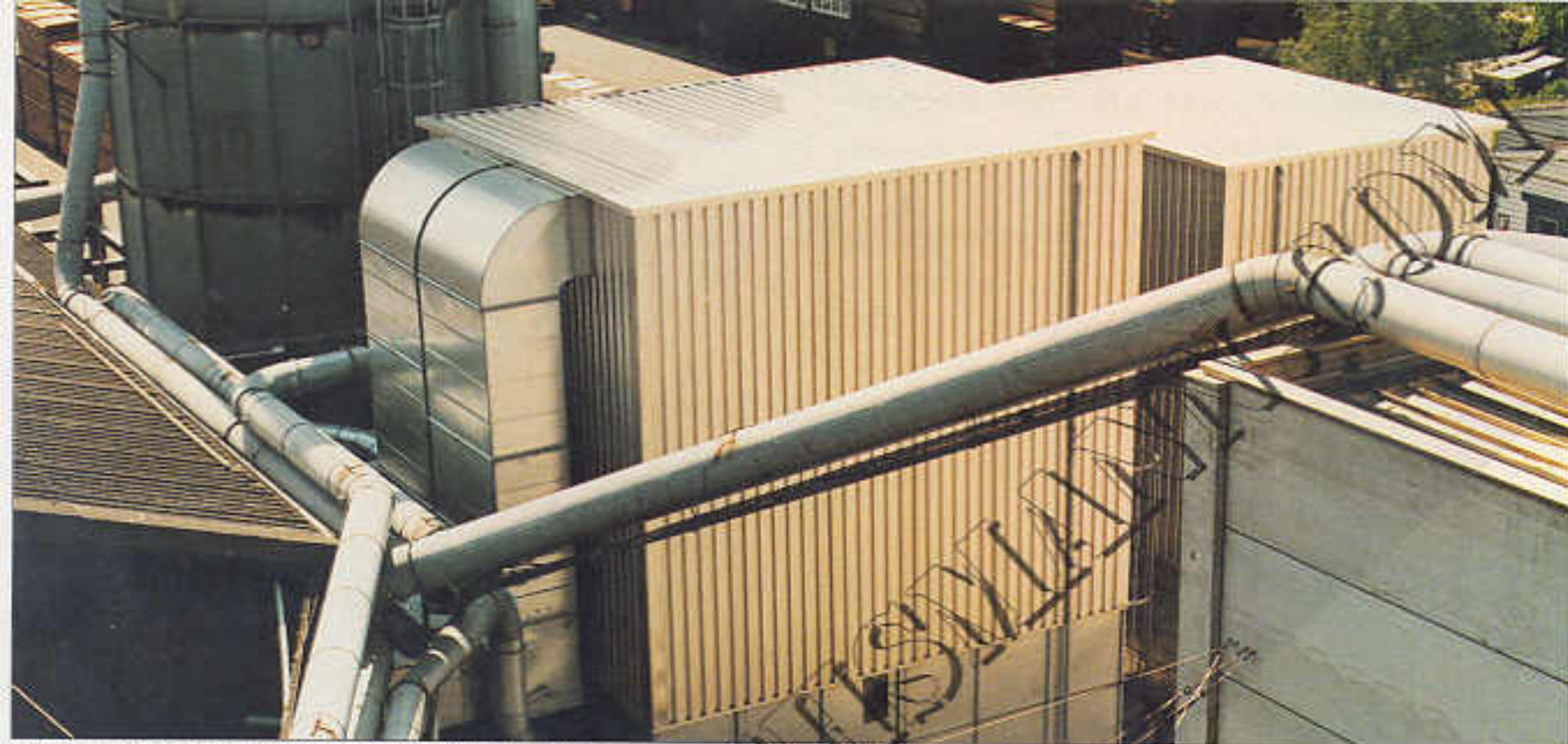
Filterhaus, Typ PFHA mit Alutrapezblechverkleidung