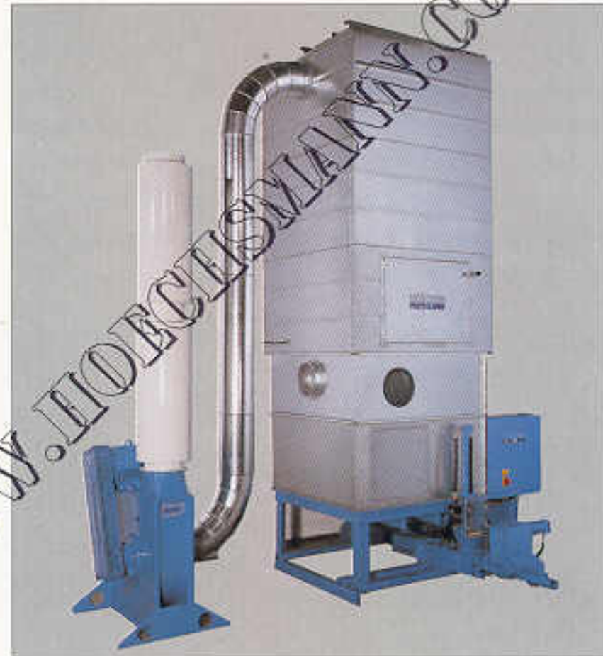
Unterdruckfilter PVVP auf Brikettierpresse

Durch die konsequente Verwendung eines Rastermaßes für alle Anlagentypen ist eine genaue Bedarfsanpassung möglich. Ebenso durchführbar ist eine spätere Erweiterung von Filterflächen oder die Umrüstung von Pausenabreinigung auf kontinuierlichen Betrieb. Zehn verschiedene Anlagentypen mit unterschiedlichen Austragesystemen rüstet Höcker Polytechnik wahlweise mit elektromechanischer Pausenabrüttelung (auch als Gegendruckfilter) oder mit Druckluft-Impulsabreinigung aus. Verschiedene Baugrößen und Filterschlauchlängen ermöglichen die Anpassung auf die erforderliche Luftmenge und den Materialanfall.