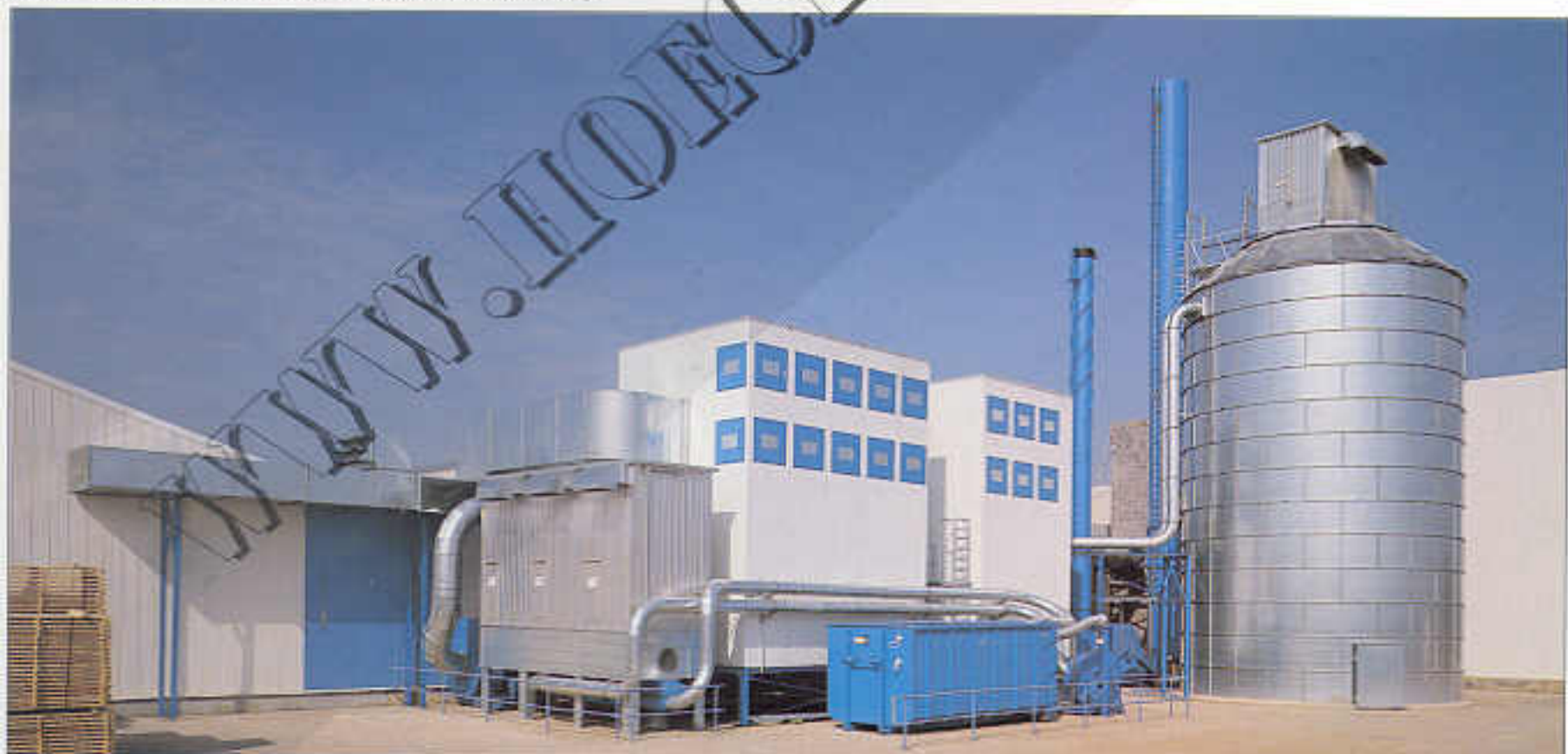
Großanlage: Zwei Filterhäuser PFHA mit Rückluftkanal, Transportanlage zum Silo bzw. Deckenfilter sowie separate Filteranlage PGSQ mit Containerbeschickung für Lackschliff