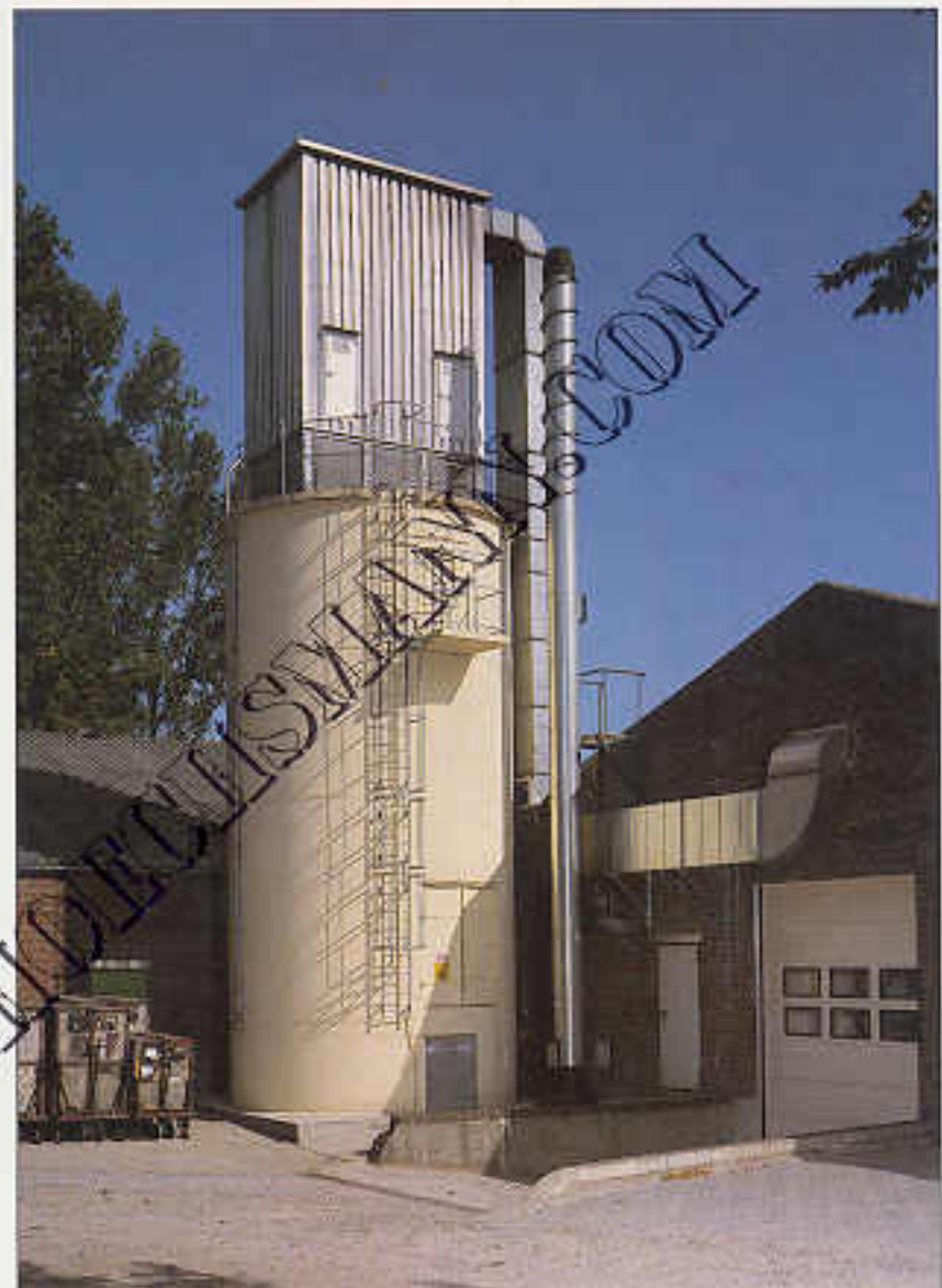
Deckenfilter, Typ PDF mit erhöhtem Einblasraum und Alutrapezverkleidung