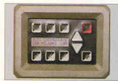
Bedientableau für Drehzahlregelung