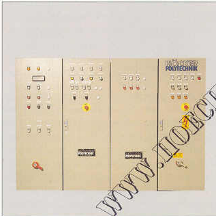
Anlagensteuerung durch übersichtliche, zentral angeordnete Schaltschränke

Schaltschränke von Höcker Polytechnik erlauben generell die Kombination mit betriebseigenen Anlagen.