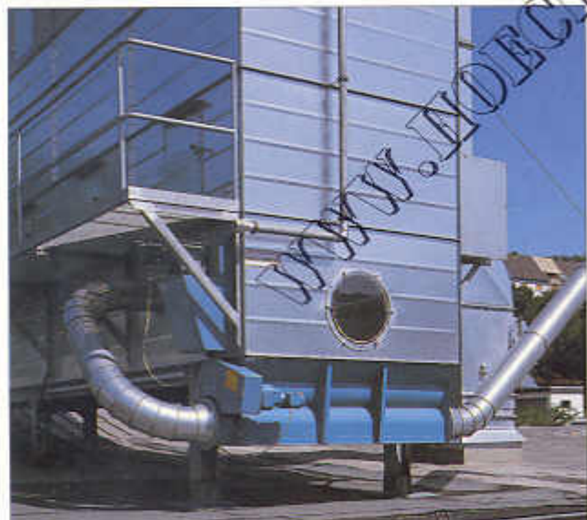
Kompaktfilter Längsbaureihe mit seitlicher Wartungsbühne