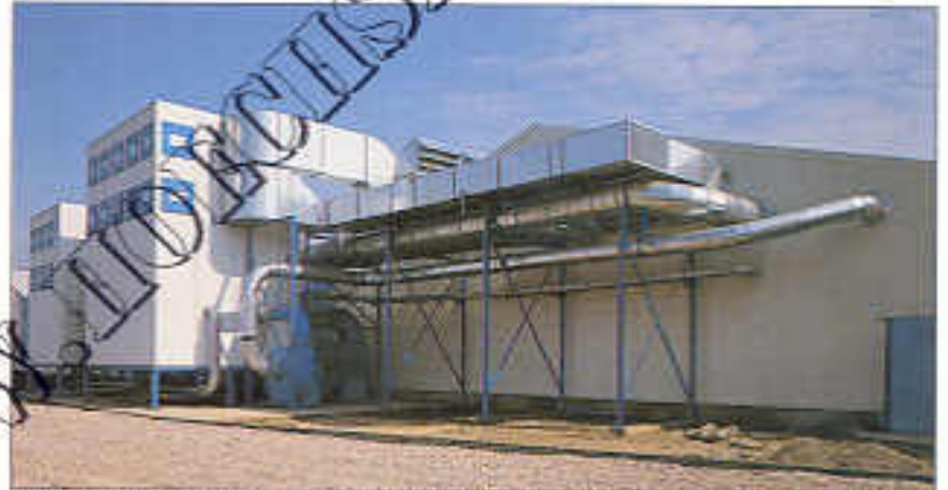
Rückluftkanalsystem mit Umlenkung und Druckentlastungsflächen

In den Hallen sorgen Kanalsysteme für gutes, zugfreies Klima. Feinfiltermatten in leicht handhabbaren Wechselrahmen sind in die Kanalsysteme integriert.