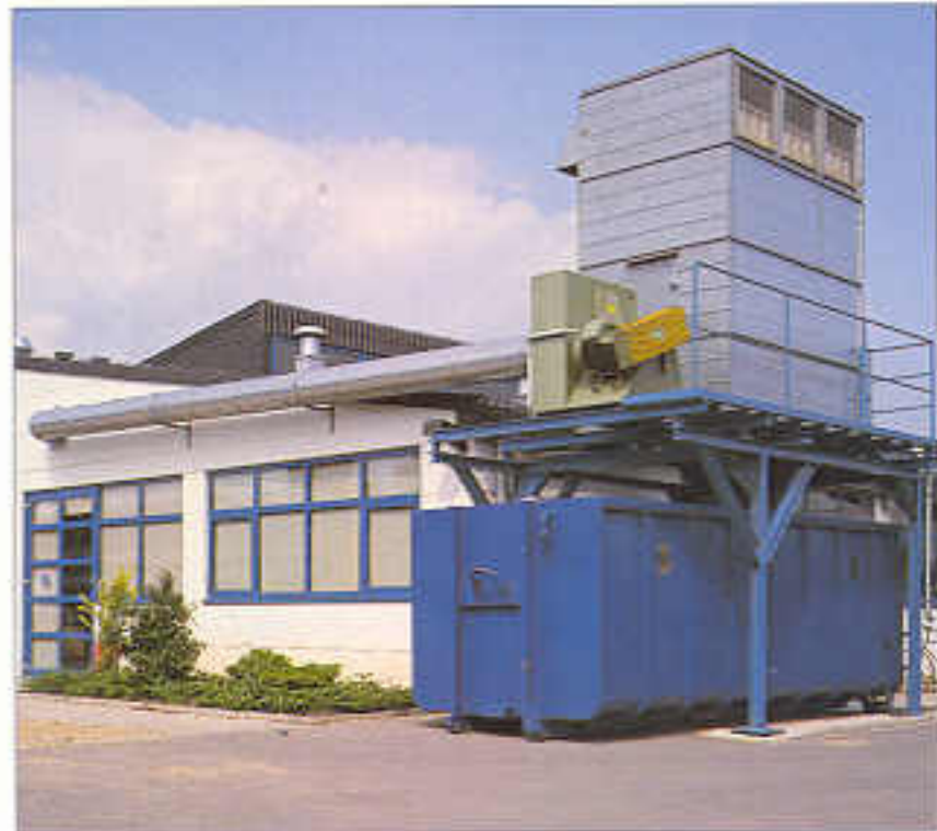
Kompaktfilter PKFQ mit Containerbeschickung