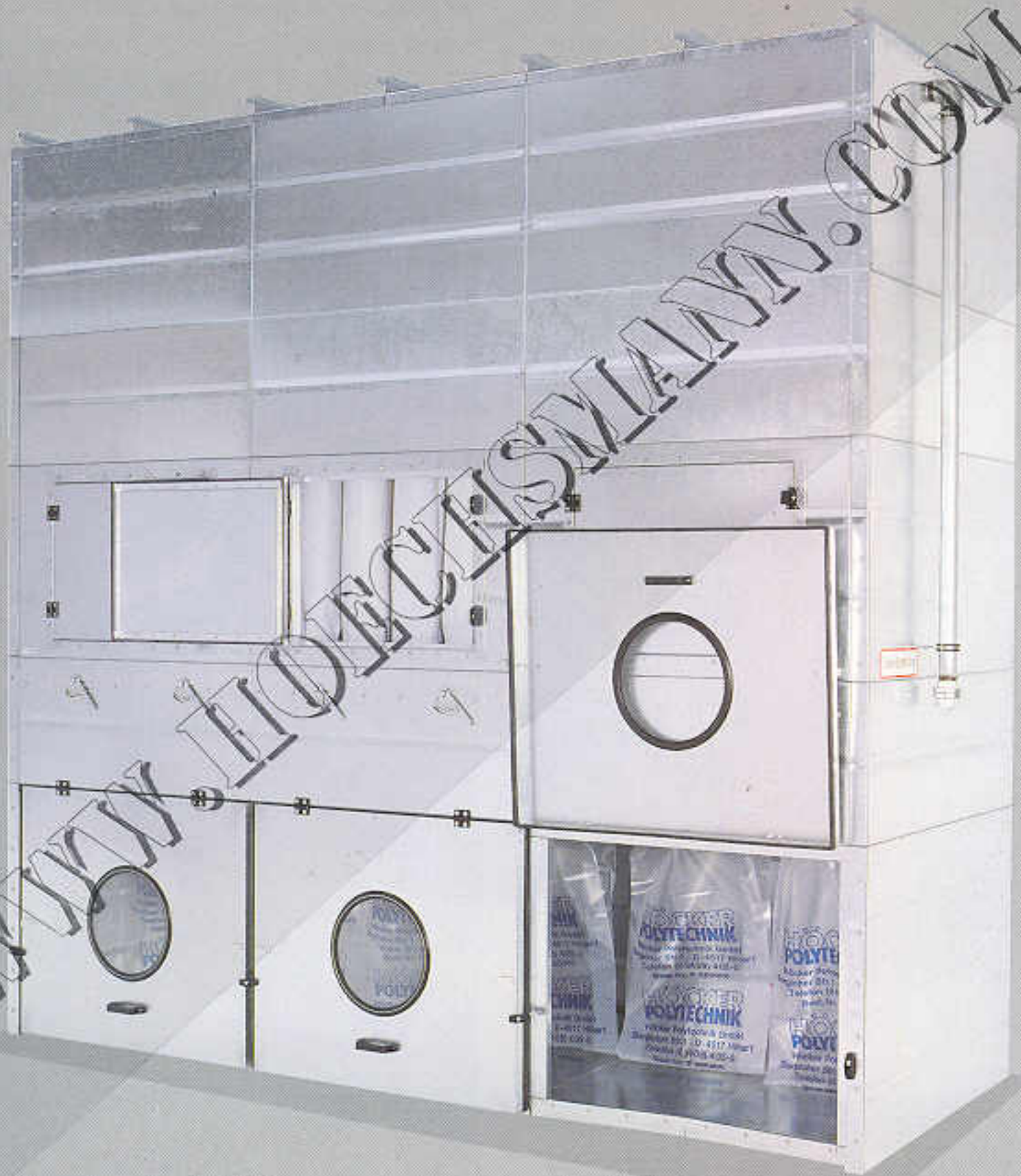
Vacu-Absackfilter mit sechs Spänefangsäcken in unterdrucksicherer Verkleidung, trockene Löschleitung (Mehrpreis)