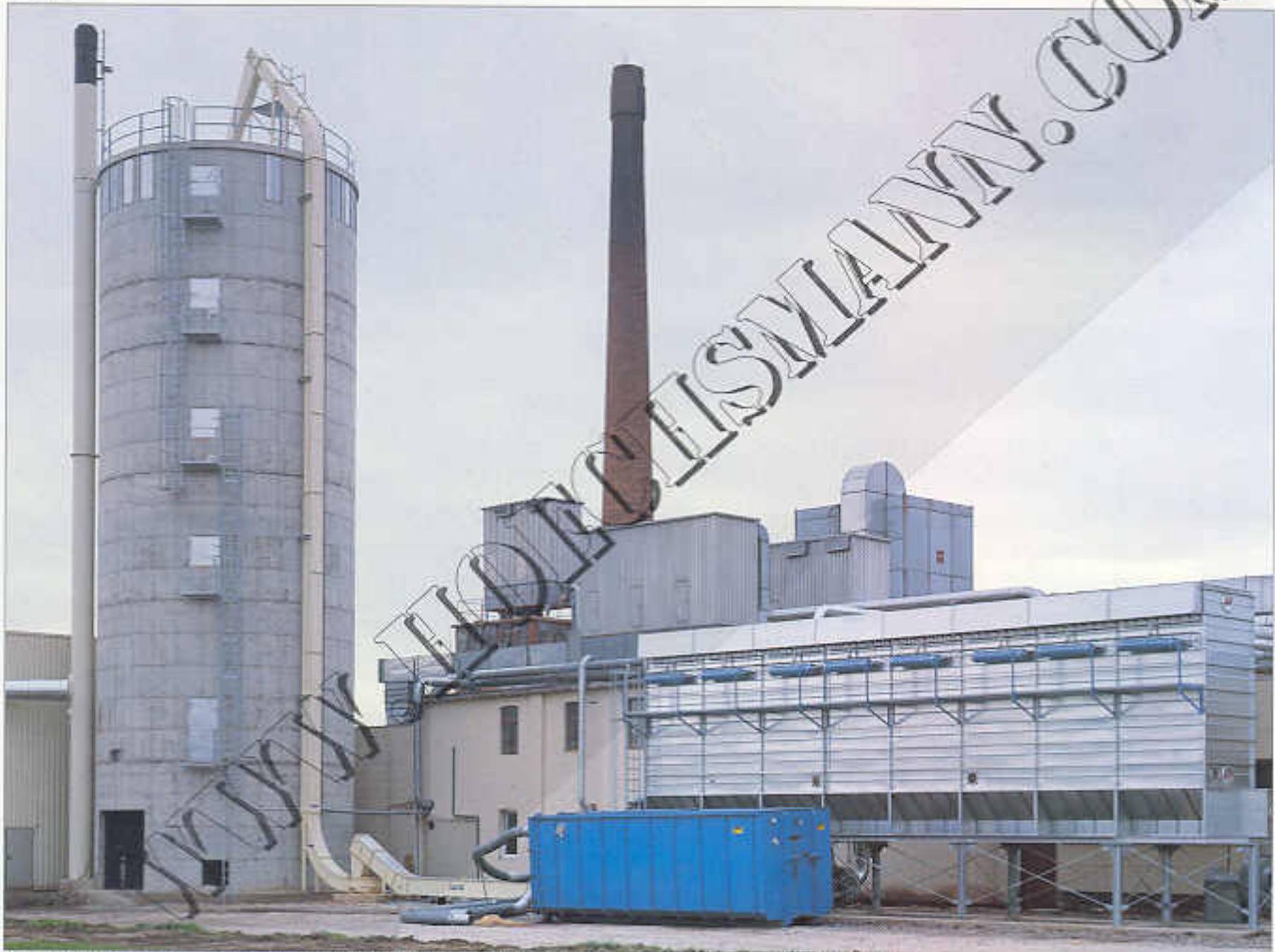
Industriefilter VacuJet, Typ PVJL 2000 mit Trogkettenförderer zur Silobeschickung, 850 m 2 Filterfläche

Die Modulbauweise erlaubt jederzeit die Erweiterung der Anlage. Die stabile Konstruktion hält Unterdrücken bis 4000 Pa stand. Auch schall- und wärmeisoliert lieferbar. Typ PVJL mit Kettenförderer und Zellenrad-schleuse zur Austragung. Typ PVJQ bis maximal drei Elemente (Umrüstung auf Kettenausstragsystem möglich).