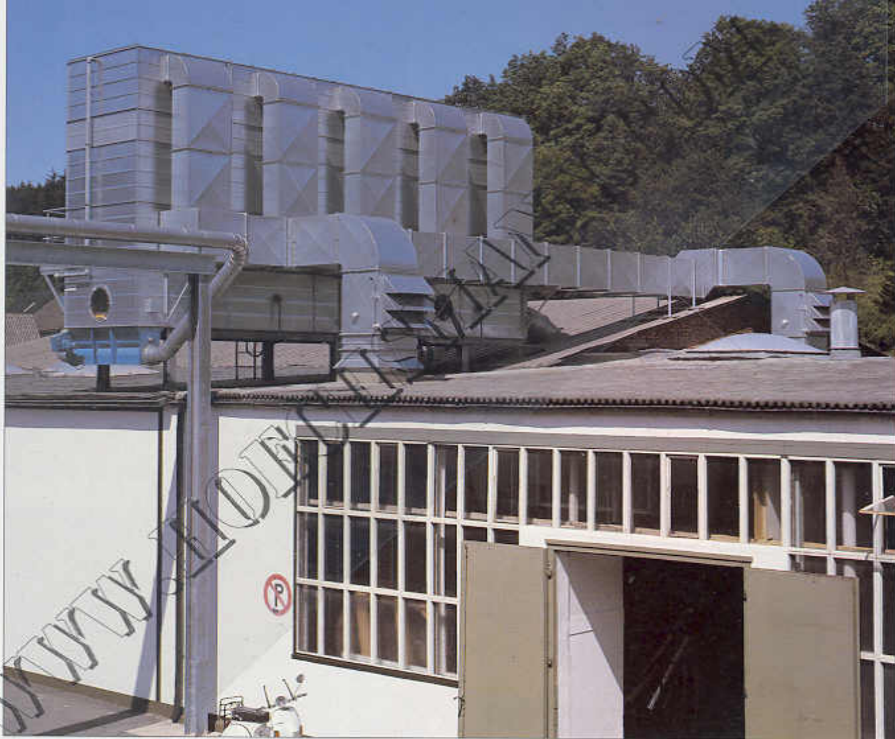
Kompaktfilteranlage PKFL 2000 mit Lufrückführung, 450 m 2 Filterfläche

Höcker Polytechnik Großfilteranlagen-Querbau- reihe PGSQ, PKFQ. Die Konstruktion entspricht im wesentlichen der der Längsbaureihen PGSL und PKFL. Die Austragung übernimmt jedoch eine gegenüber der Einblasseite angeordnete Zellenradschleuse. Seitliche