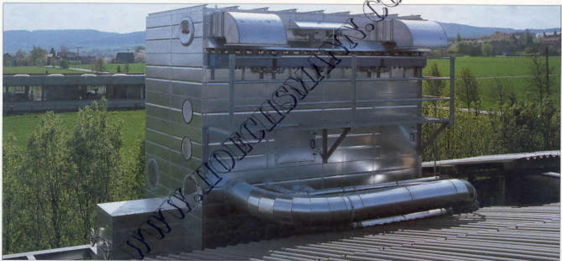
Jet-Filteranlage PVJL mit 230 m 2 Filterfläche; Abluftbetrieb

Bewährte Austragesysteme und stabile Konstruktion kombiniert mit neuartigen Filtermaterialien und modernsten Ventilatorsteuerungen gewährleisten höchste Betriebssicherheit und geringen Energieverbrauch.