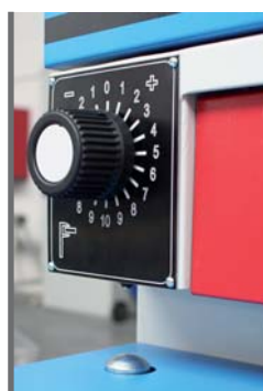
ODMĚŘOVÁNÍ VÝŠKY OBROBKU - POZICIONER STOLU