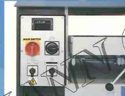
Panel de mandos