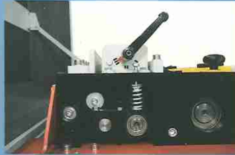
Fácil acceso a las distintas partes de la máquina