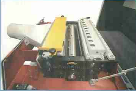
Eje de cuatro cuchillas