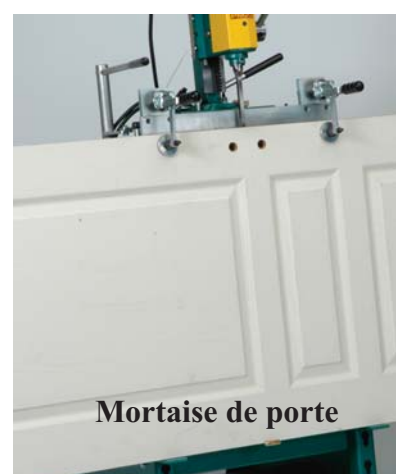
Mortaise de porte