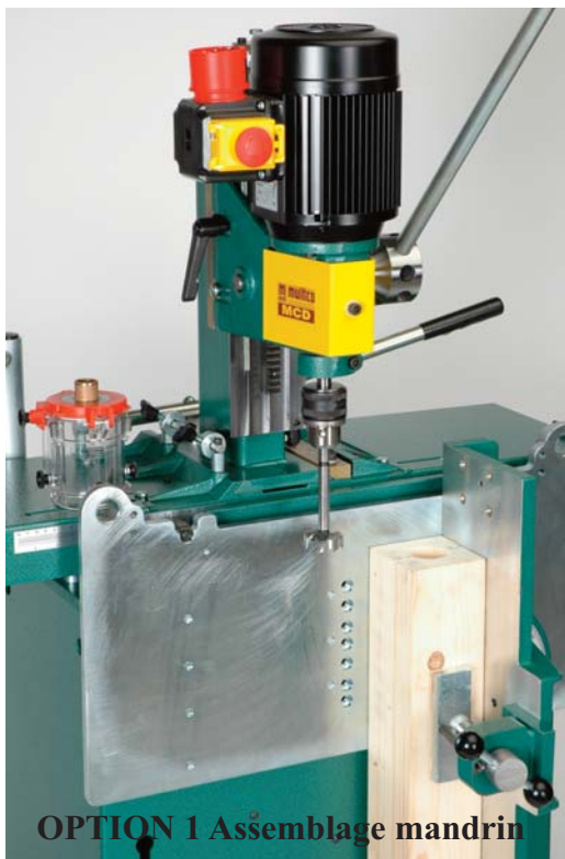
OPTION 1 Assemblage mandrin