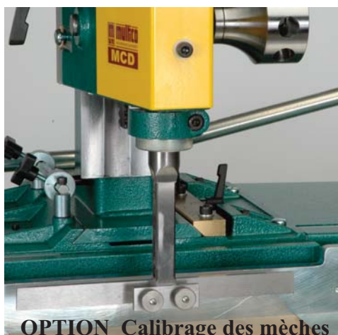
OPTION Calibrage des mèches