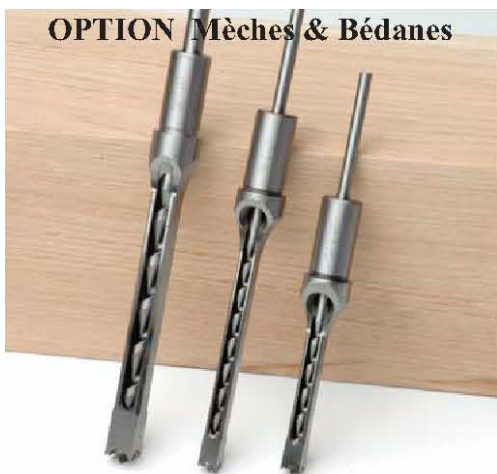
OPTION Mèches & Bédanes