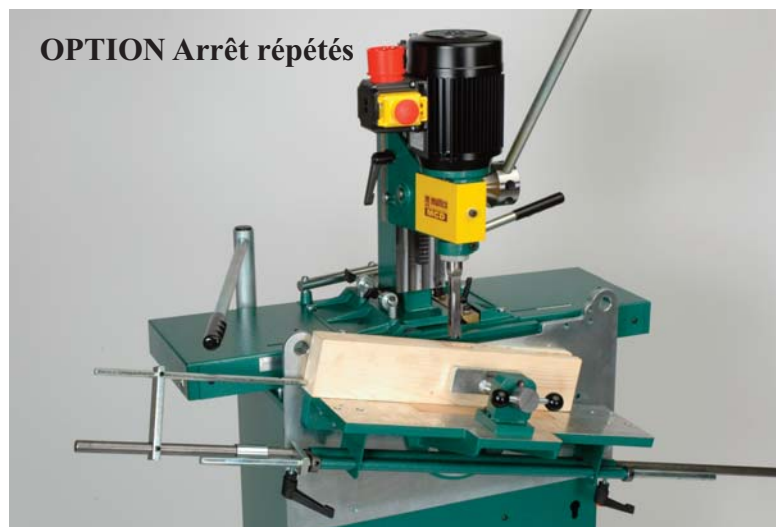
OPTION Arrêt répétés