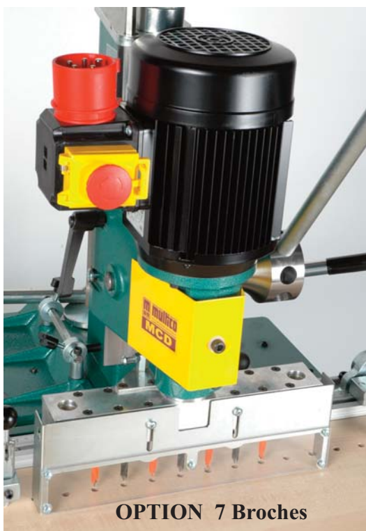
OPTION 7 Broches