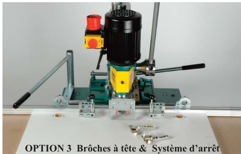
OPTION 3 Brôches à tête & Système d'arrêt