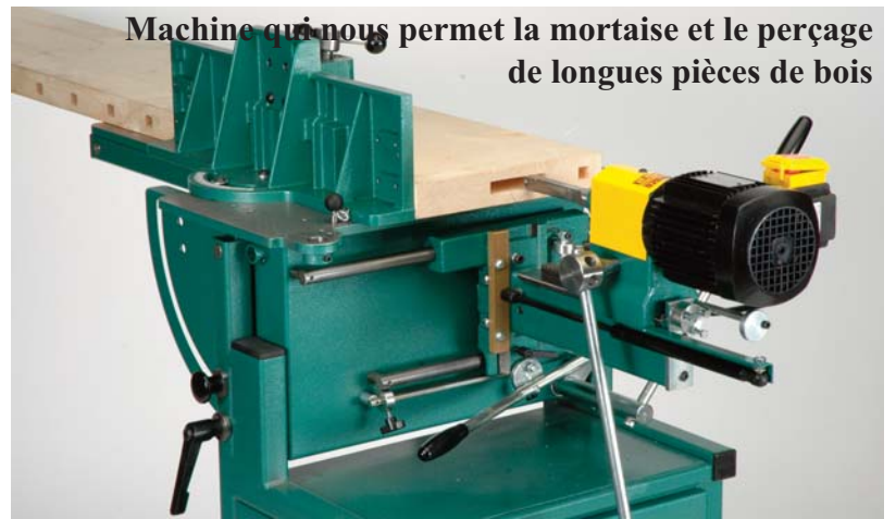
Machine qui nous permet la mortaise et le perçage de longues pièces de bois