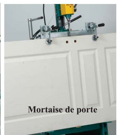
Mortaise de porte