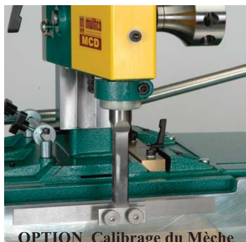
OPTION Calibrage du Mèche