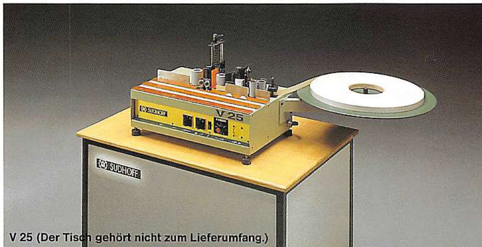
V 25 (Der Tisch gehört nicht zum Lieferumfang.)