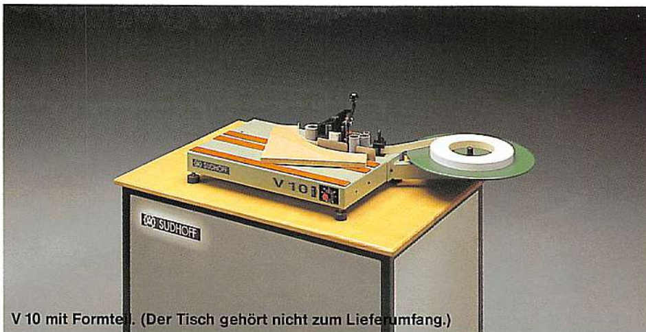
V 10 mit Formteil. (Der Tisch gehört nicht zum Lieferumfang.)