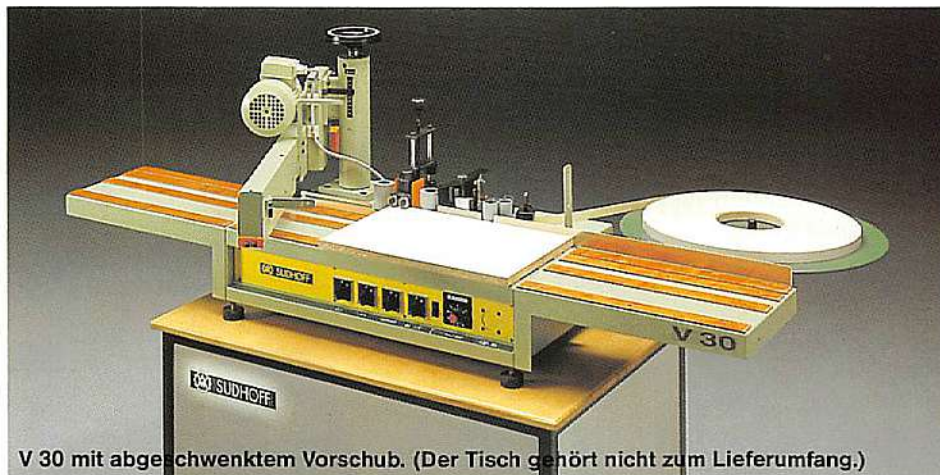
V 30 mit abgeschwenktem Vorschub. (Der Tisch gehört nicht zum Lieferumfang.)