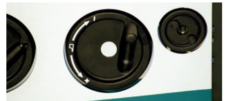
Verstellung Parallelanschlag mit Handrad und Handrad für Feinverstellung