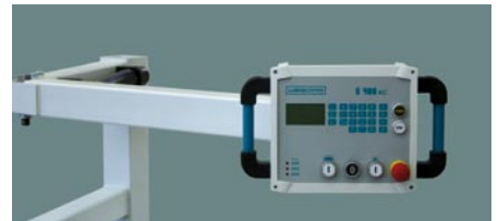
Bedienpanel mit Schwenkarm (S400NC)