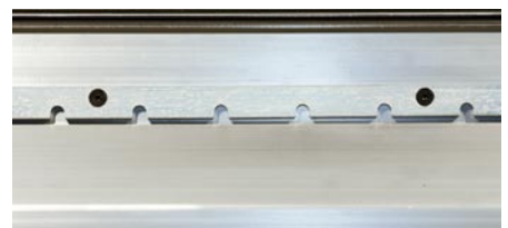
Feststellraster in 50 mm Abständen