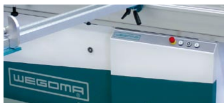
Maschinenfront ohne Handränder