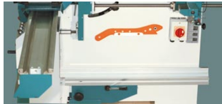
Halterung für Parallelanschlag