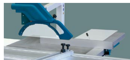
Parallelanschlag elektrisch gesteuert