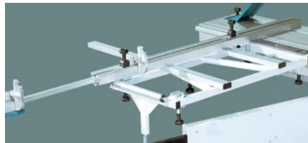
Winkelanschlag ausziehbar bis 3250 mm