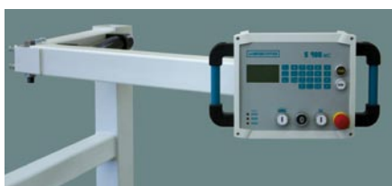
mit schwenkbarem Arm