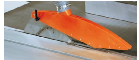
Sägehaube am Spaltkeil befestigt