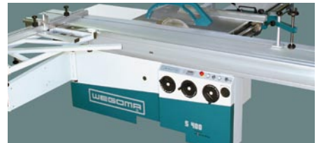
Maschinenständer (S315, S400)