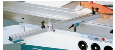
Gehrungsanschlag ohne Aufpreis im Grundlieferumfang