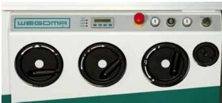
Bedienfront: Höheneinstellung, Winkleinstellung, Verstellung Parallelanschlag