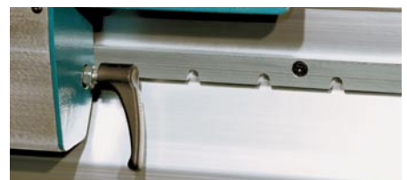
Einfache und sichere Klemmung