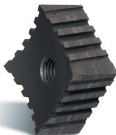
CROSSCUT ▶ für mehr Schnitte