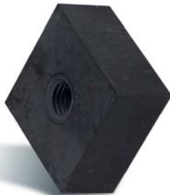
GLATT ▶ für störstofffreie Anwendungen