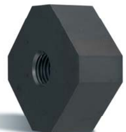
TRAPEZ ▶ für extreme Anwendungen