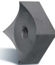
EXTRA-KONKAV ▶ für flexible Materialien