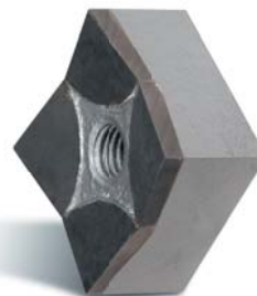
HARTMETALL ▶ für deutlich längere Standzeiten