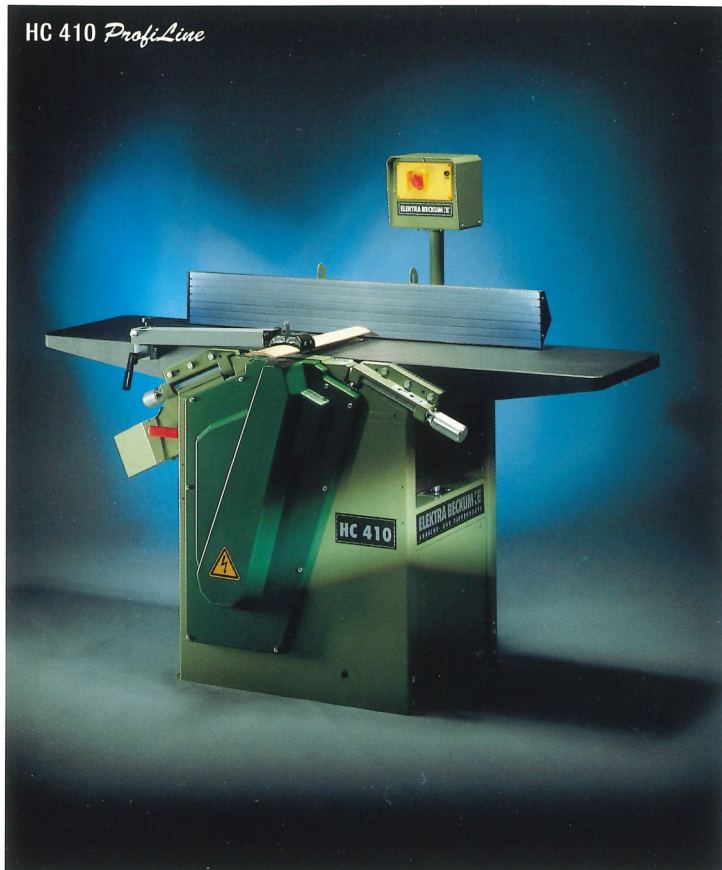
HC 410 ProfiLine