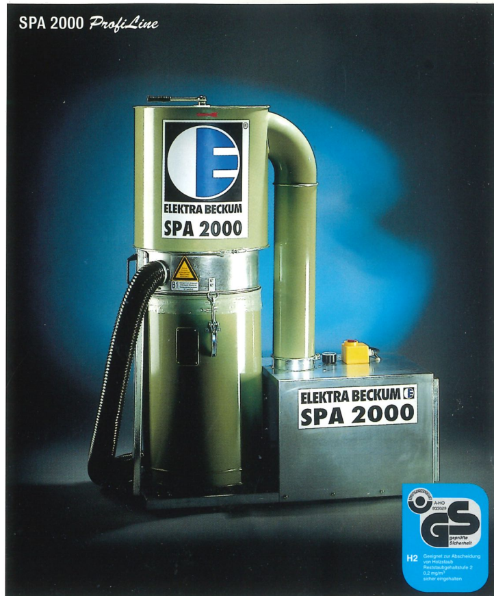
SPA 2000 ProfiLine