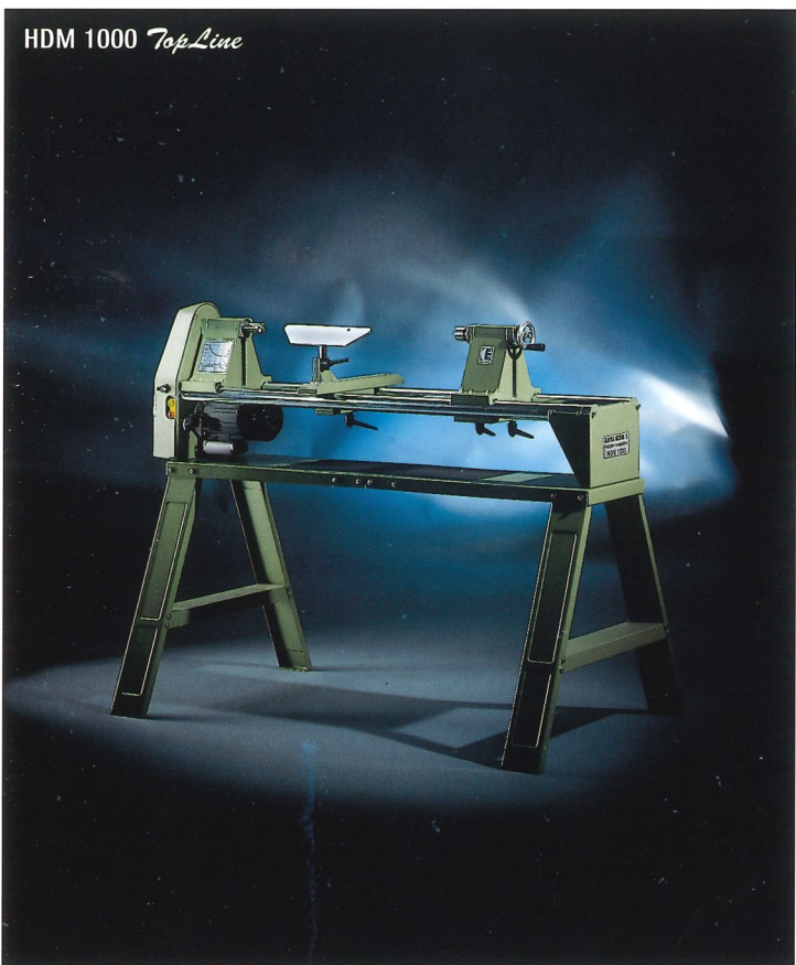
HDM 1000 TopLine