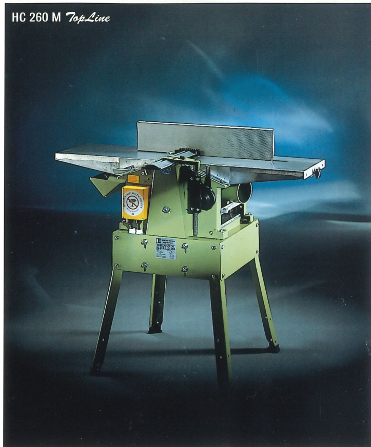
HC 260 M TopLine