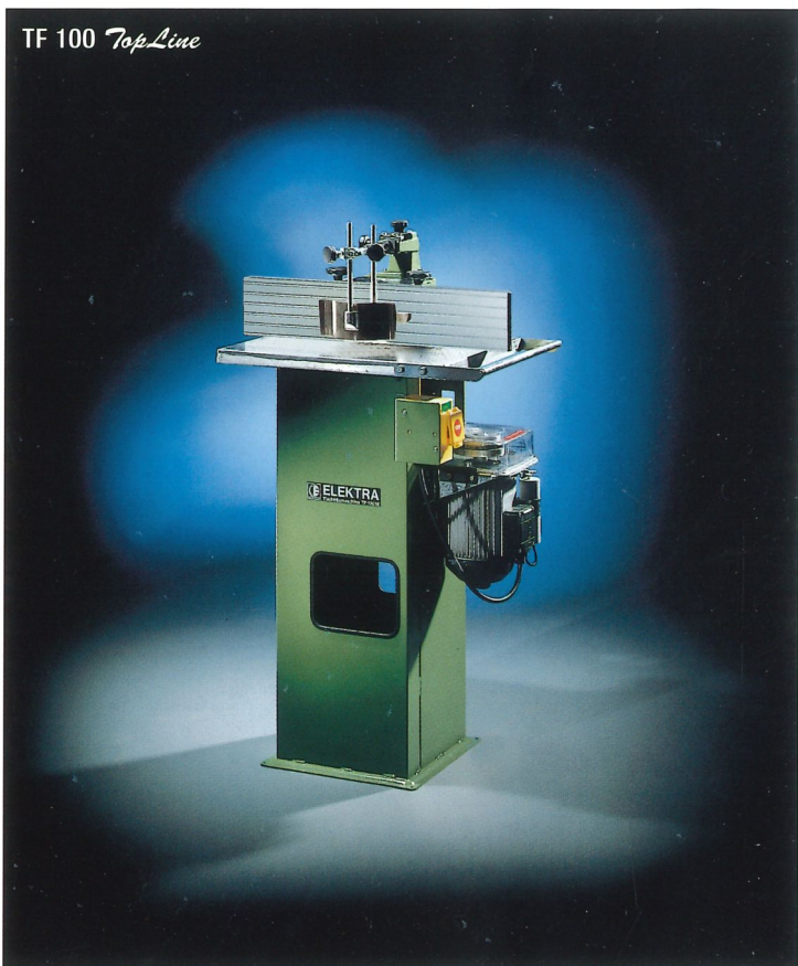
TF 100 TopLine