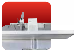
Abrichtanschlag Absolute Steifigkeit

Spitzentechnologie zu einem erschwinglichen Preis bei den professionellen Hobelaggregaten für anspruchsvolle Tischlerei- und Handwerksbetriebe, die nach oben streben und sich nicht so einfach begnügen.