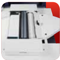
Hobelwelle Perfekte Fertigungsqualität