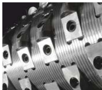
Rotore Versione 5

Le corone circolari rettificata a forma concava permettono un'elevata portata con un dispendio minimo di forza, grazie ad un taglio efficiente. I supporti delle lame sono montati o saldati sul rotore profilato. Le lame possono essere girate fino a 8 volte con pochi movimenti, prima di doverle sostituire.