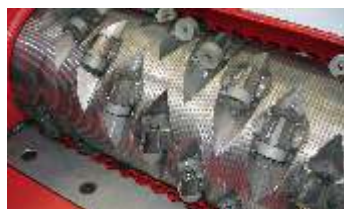
Rotore-Ver. 7 (40 mm lami-Ø)

Diversi diametri del rotore: 482 mm, 354 mm e 252 mm per le più disparate applicazioni e portate