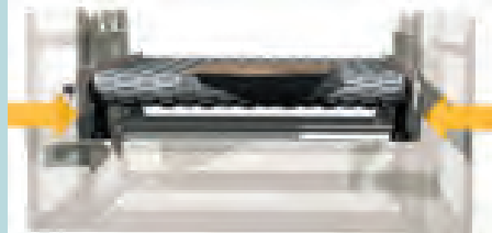
Table lifting system: Innovative conveyor table lifting system by means of four pistons and integrated with a further table retention system on the four specially worked and ground sides of the bed. This system provides a standard of strength and precision that is unique in the calibration-sanding machine industry.

ЭЛЕКТРОННЫЙ GRIT-SET – оптимальная система для автоматической записи различной степени съема, как на стадии калибровки, так и на стадии шлифовки. Таким образом существенно облегчается регулировка валов, ускоряется и становится более точным рабочий процесс.