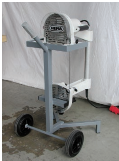
Transportwagen zum Absetzen und Aufbewahren der Maschine.

Robustes Aluminiumguss-Gehäuse, seitlich versetzter Bügel, großflächiger Tisch mit zwei Schnittzeigern, gute Sicht auf den Schnittbereich. Aluminiumräder mit vulkanisierten und geschliffenen Gummibelägen, dynamisch ausgewuchtet, schwingungsdämpfende Radfederung, 4 verschleißfeste Hartmetall-Sägeblattführungen, Sicherheits-Schalter. 2 Bandsägeblätter 6 mm und 1 Sägeblatt 13 mm breit, 10 m Kabel mit Stecker. Kann als Ein- und Zweimann-Handbandsäge eingesetzt werden.