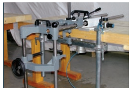
Horizontalschlitzeinrichtung, Schlittiefe max. 400 mm, schnelle Montage des Kettenstemmers ZKS 15, schwenkbar bis 60°.