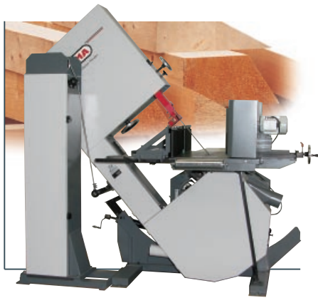
Schwentrechtsäge UH 800 SBS TR

Ständig auf Lager, für alle Typen: Bandmesser, Bandsägeblätter, Einweg-Wendehobelmesser, Fräsköpfe, Fräsketten, Sägeketten, Schleifbänder, Kopfsenker, Holz- und Stachetenbohrer, Ersatzteile und Zubehör.