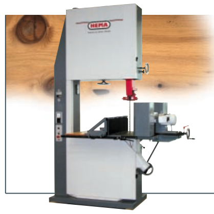
Trennbandsäge UH 800 TR, UH 900 TR