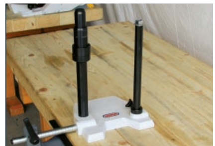
Führungsgestell zum Stemmen, Stemmtiefe 90 mm, inkl. Anschlag. Maschinengewicht durch Gasfeder ausgeglichen.