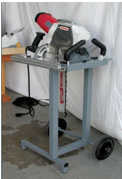
Standstücker Transportwagen für KS 380

Diese neue Kettensäge hat HEMA den Zimmerleuten in die Hand gebaut. Die ausgereifte Entwicklung der KS 380 verbindet durch große Schnitttiefe und beidseitige Schwenkbarkeit wichtige Anwendungsbereiche miteinander: Sowohl als Abschnittssäge als auch bei der Einzelbearbeitung von Schiftern, Pfettenabschnitten und Verbindungen liefert die robuste Maschine beste Schnittergebnisse.