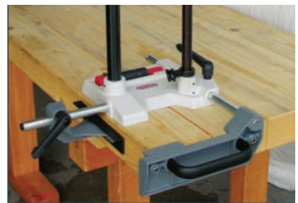
Gestell zum Schlitzen, Schlittiefe 305 mm, inkl. Seiten- und Breitenanschlag. Maschinengewicht durch Gasfeder ausgeglichen.