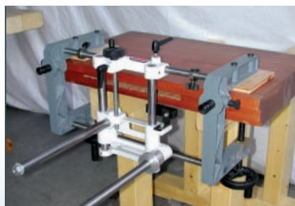
Schlosskasten-Fräsvorrichtung, Aufspannrahmen mit Quer- und Längshub zur Aufnahme des Kettenstemmers ZKS 15. Schlosskastenlänge max. 245 mm. Ohne Fräskettengarnitur.