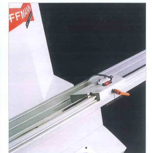
Zubehör Anschlagverlängerung Bestell-Nr. M 305 0000