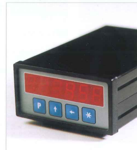
Zubehör Elektronische Digitalanzeige Bestell-Nr. M 302 0000