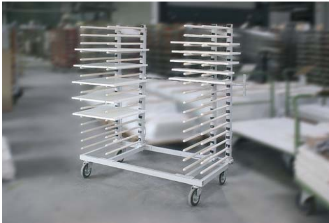
Hordenwagen HWV zum Ablegen und Transportieren von schweren Werkstücken

Hordenwagen mit besonders hoher Traglast zum schonenden Ablegen und Transportieren von Werkstücken.