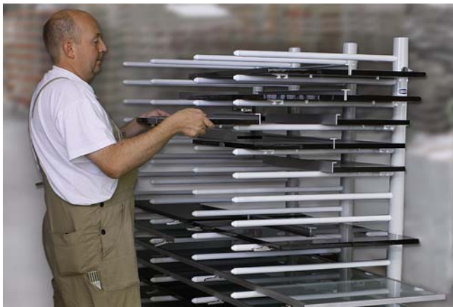
Hordenwagen HW zum Ablegen und Transportieren von Werkstücken

Hordenwagen zum schonenden Ablegen und Transportieren von Werkstücken.