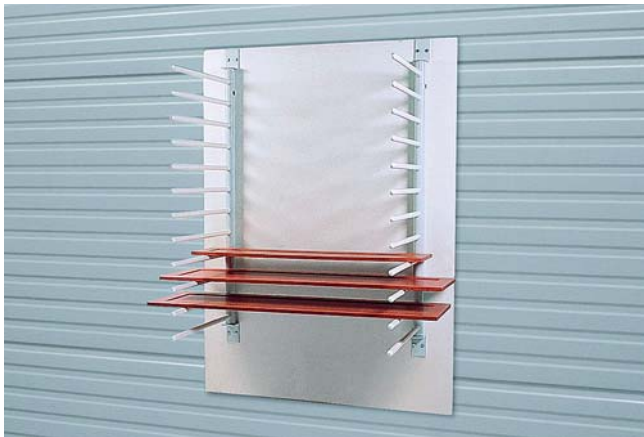
Wandablage WA (2 Stück abgebildet) zum Ablegen von Werkstücken

Komfortable, werkstückschonende Ablage zur Montage an der Wand.