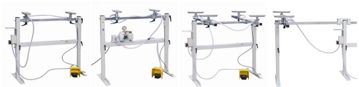
Vakuum-Arbeitstisch mit zwei Saugplatten und Ejektor SEG