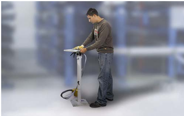
Vakuum-Arbeitsständer PVS zur Bearbeitung von kleineren Werkstücken

Mechanische Bearbeitung ohne Umspannen des Werkstücks.