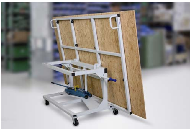
Plattentransportwagen PTS 250 zur Aufnahme aus stehenden Plattenlagern

Transportwagen zur Be- und Entladung von liegenden und stehenden Sägen.