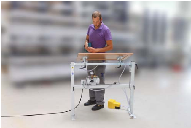
Vakuum-Arbeitstisch PVT mit Vakuum-Pumpe und zwei Saugplatten bei der Bearbeitung eines Möbelteils

Mechanische Bearbeitung ohne Umspannen des Werkstücks.