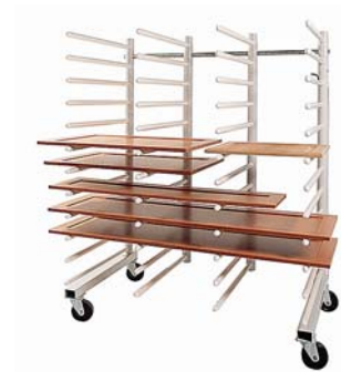
Hordenwagen mit vier Rechen