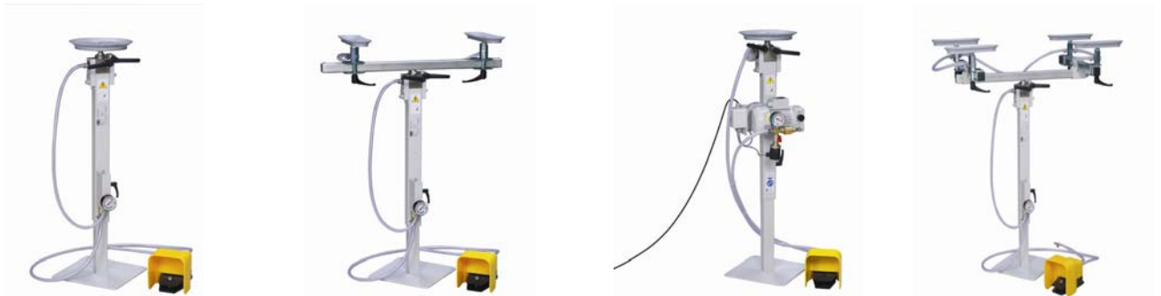
Vakuum-Arbeitsständer mit einer Saugplatte und Ejektor SEG