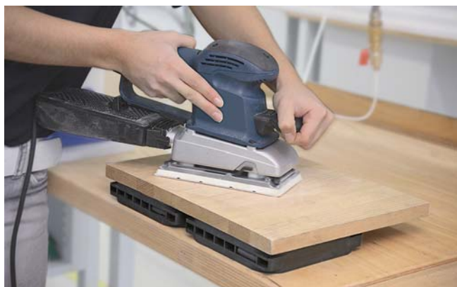
Multi-Clamp Saugplatte zum Aufspannen von Werkstücken direkt auf der Werkbank

Die Multi-Clamp Saugplatte wird auf der Werkbank angesaugt oder festgeschraubt. Mit Hilfe von Vakuum hält die Saugplatte das Werkstück zuverlässig und sicher. Mehrere Multi-Clamp Saugplatten nebeneinander spannen auch großflächige Werkstücke.