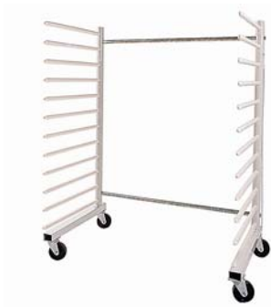
Hordenwagen mit zwei Rechen