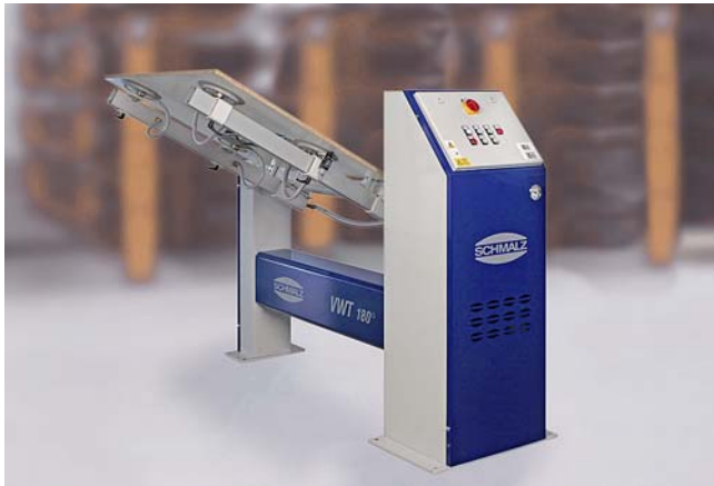
Vakuum-Wendetisch VWT 180° zum Schwenken von Werkstücken

Bearbeitung von großformatigem Plattenmaterial an der Ober- und Unterseite, ohne Umspannen des Werkstücks.