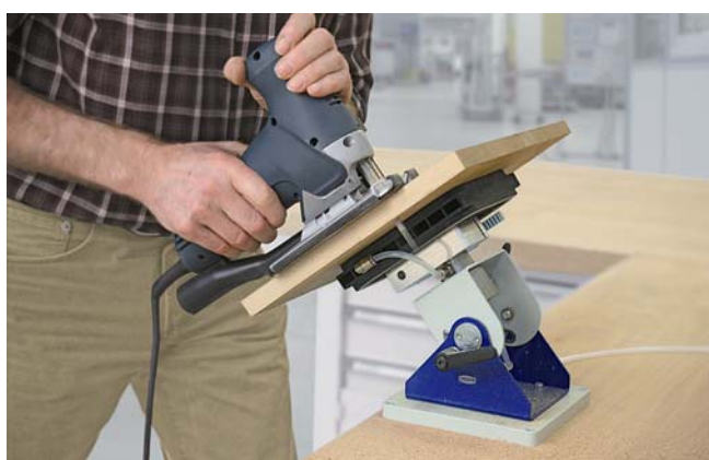
Vakuum-Aufspannsystem Multi-Clamp zum Aufspannen und Schwenken von Werkstücken direkt auf der Werkbank

Das Vakuum-Aufspannsystem Multi-Clamp ist das perfekte Werkzeug, um kleine und mittelgroße Werkstücke ergonomisch zu spannen. Die Werkstücke werden mit der Multi-Clamp rundum bearbeitet, ohne das Werkstück umspannen zu müssen.