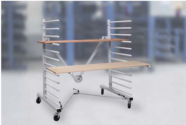
Hordenwagen HWZ zum Ablegen und Transportieren von Werkstücken

Zusammenschiebbarer Hordenwagen zum schonenden Ablegen und Transportieren von Werkstücken mit verschiedenen Maßen.