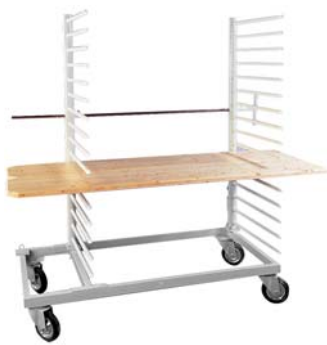
Hordenwagen mit zwei Rechen, einer davon beweglich