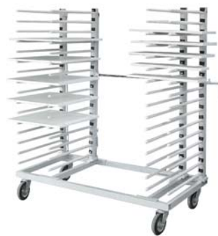
Hordenwagen mit vier Rechen, zwei davon beweglich