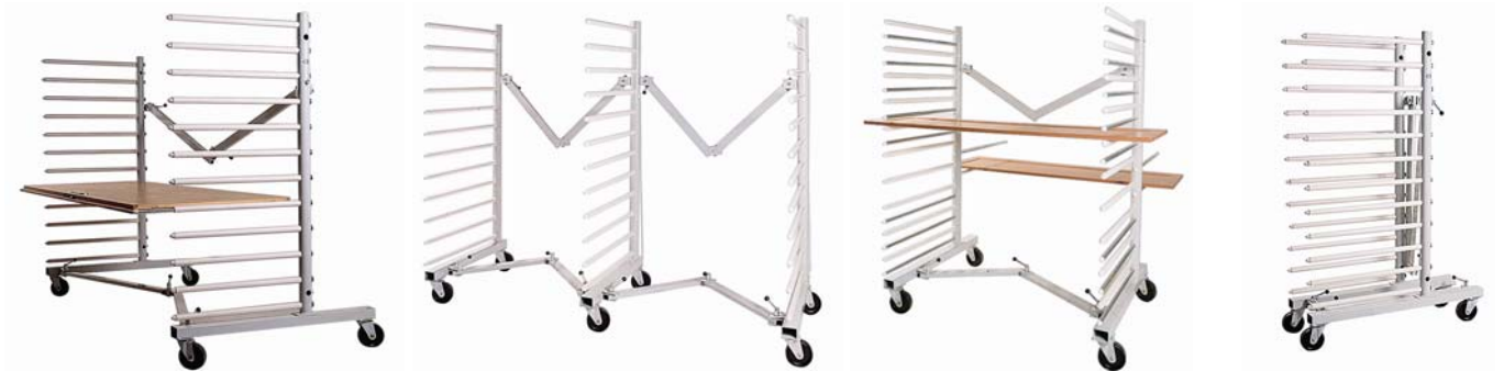
Hordenwagen mit ausziehbaren Etagen