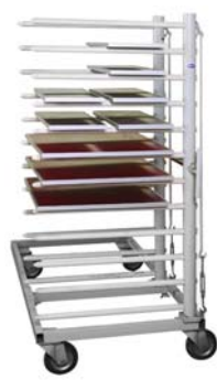
Hordenwagen mit zwei Rechen