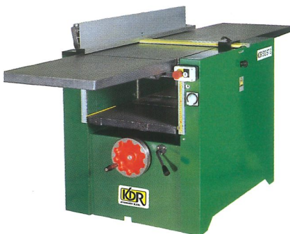
Abricht- und Dickenhobelmaschine mit den kippbaren Tischen KDR 510 ST S Breite der Hobelwelle 510 mm, 4 Messer Abrichtschlänge 2200 mm Dicken 4 - 250 mm