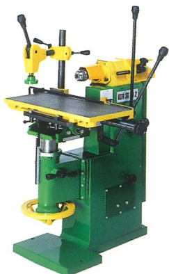
Langlochbohrmaschine KDR 30 VD 2 max. Bohrerdurchmesser 30 mm Drehzahl 2500, 3500, 4500 min -1 neigbarer und schwenkbarer Tisch