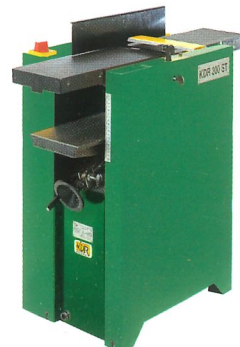
Abricht- und Dickenhobelmaschine KDR 200 ST Breite der Hobelwelle 200 mm 2 Messer, Dicken 4 - 140 mm