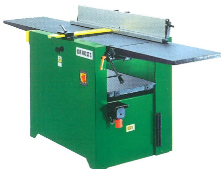
Abricht- und Dickenhobelmaschine mit den kippbaren Tischen KDR 410 ST S Breite der Hobelwelle 410 mm, 4 Messer Abrichtschlänge 2200 mm, Dicken 4 - 200 mm