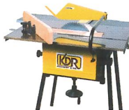
Kreissäge mit Anpassungsmöglichkeit für Fräsmaschine KDR 250 PF