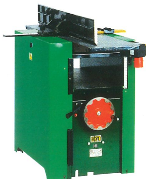
Abricht- und Dickenhobelmaschine KDR 310 ST Breite der Hobelwelle 310 mm, 4 Messer Dicken 4 - 180 mm, Möglichkeit der Befestigung von Langlochbohrmaschine KDR 16 PD/310