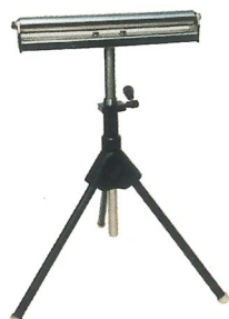
Rollbock KDR PS 95 Arbeitshöhe bis 950 mm Arbeitsbreite 380 mm