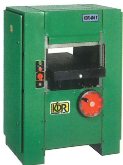
Dickenhobelmaschine KDR 410 T Breite der Hobelwelle 410 mm, 4 Messer Dicken 4 - 180 mm, Vorschub 8,5 ms -1