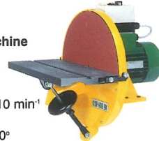
Stirnscheibenschleifmaschine KDR 400 BK Schleifscheiben- durchmesser 400 mm Schleifscheibendrehzahl 910 min -1 Schwenkbereich des Arbeitstisches + 20° - 10°