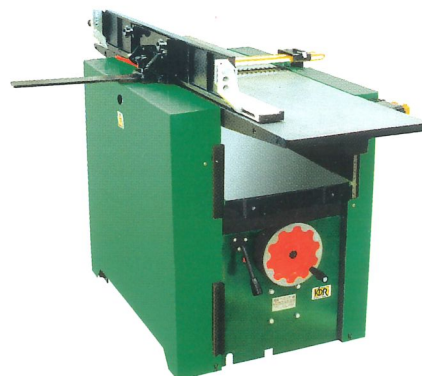
Abricht- und Dickenhobelmaschine KDR 410 ST Breite der Hobelwelle 410 mm, 4 Messer Dicken 4 - 2000 mm, Möglichkeit der Befestigung von Langlochbohrmaschine KDR 16 PD/410