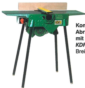
Kombinierte Abrichtmaschine mit Zusatzeinrichtungen KDR 250 S Breite der Hobelwelle 250 mm