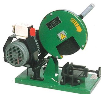
Tragbare Trennschleifmaschine KDR 300 PR Durchmesser des Schneidstoffes bis 50 mm, max. Schnittwinkel bis 45°