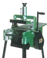
Dickenhobel- maschine KDR 250 T