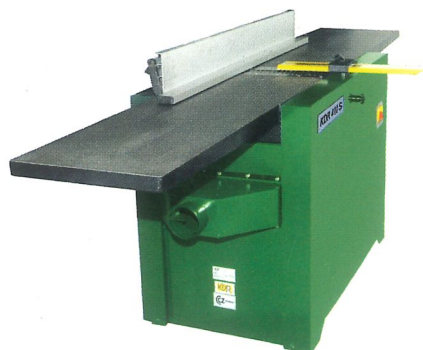
Einseitige holzbearbeitende Abrichtmaschine KDR 410 S Breite der Hobelwelle 410 mm 4 Messer, Abrichtschlänge 2200 mm