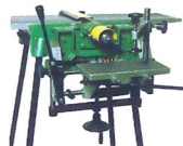
Langlochbohr- maschine KDR 16 VD/250