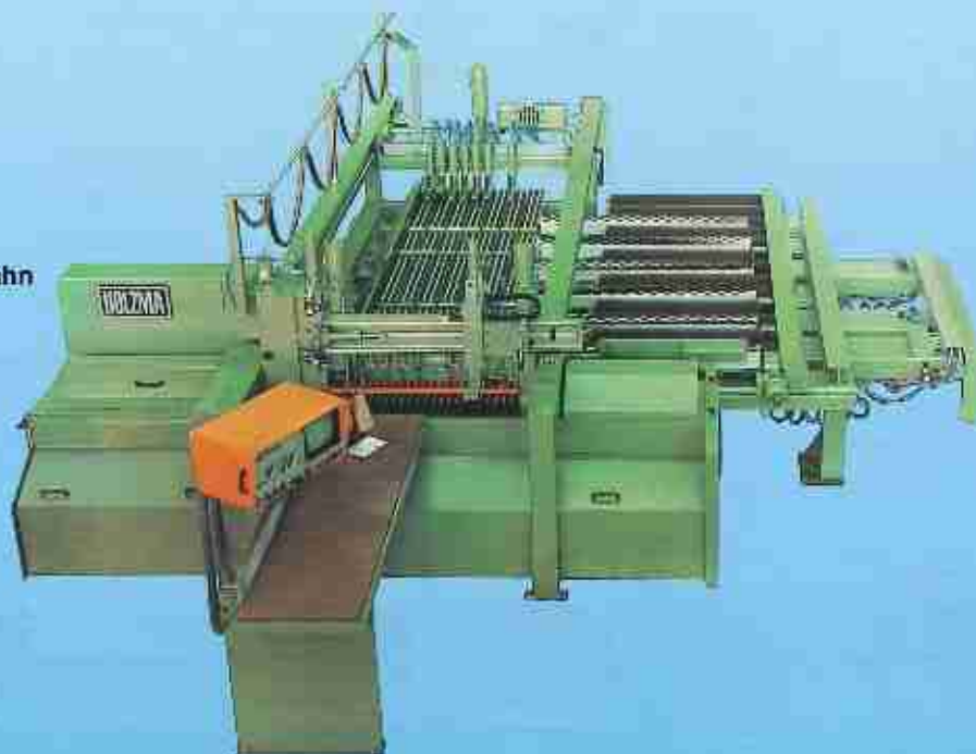
Abb.: Teilweise in Sonderausstattung