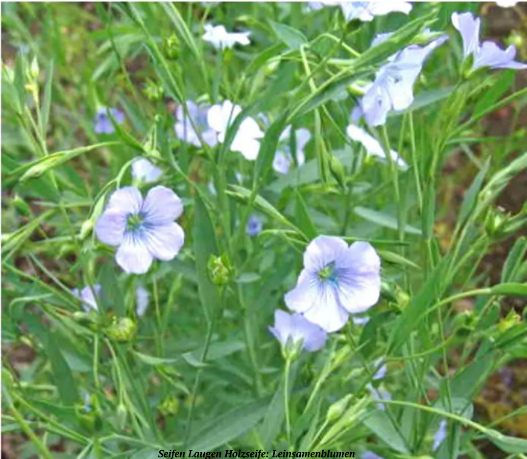
Seifen Laugen Holzseife: Leinsamenblumen

Anweisungen ( https://www.youtube.com/watch?v=Izw6Ed8aFW8 )